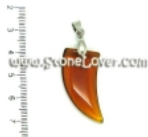
Amber Pendant / à, ^à, µà¹%ò, -à, ³à, žà, ±à, ™